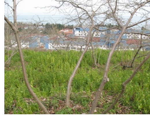
Ocak dikim sisteminde şekil budaması yapılmış bir fındık ocağı

2-Şekil Budaması: Fındık yetiştiriciliğinde ocak dikim sistemi üreticiler tarafından kullanılmakla birlikte tek gövde, çit dikim sistemleri de yaygınlaşmaktadır. Şekil budaması dikim sistemine bağlı kalarak her yıl dal üzerinde yapılan budamaları kapsamaktadır.