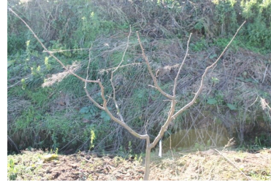
Tek gövde dikim sisteminde şekil budaması yapılmış bir fındık fidanı