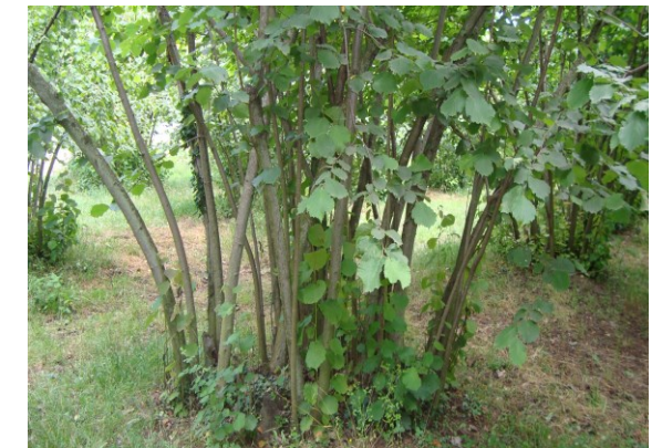
Dip temizliği yapılmamış bir fındık ocağı