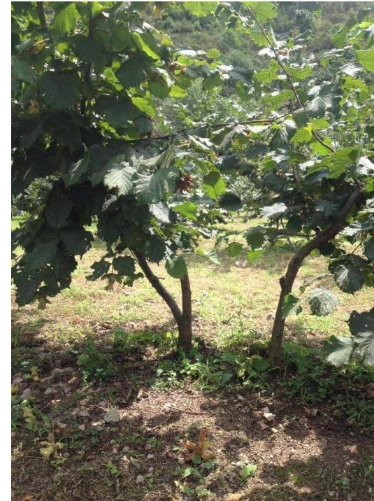
Çit dikim sisteminde şekil budaması yapılmış fındık fidanları

3-Verim (Ürün) Budaması: Fındıkta tam verim çağı çeşide, bakım şartlarına ve ekolojiye göre değişmekle birlikte 20-25 yaşlarına kadar devam etmektedir. Bundan sonra ana dallar üzerindeki yan dallarda sıklaşma, sürgün faaliyetlerinde ve buna bağlı olarak da verimde azalmalar gözükür.